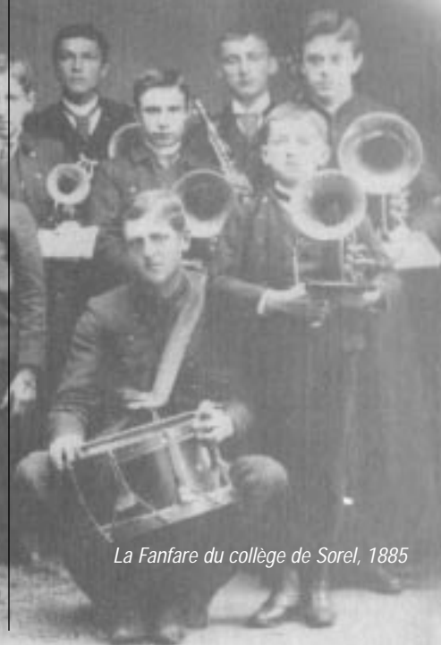
La Fanfare du collège de Sorel, 1885