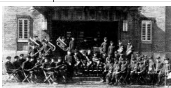
Cercle philharmonique de St-Jean, 1949

Le Festival a cessé d'être un événement itinérant en 1988 alors qu'un protocole d'entente a été signé avec le Mouvement Musical Mitchell Montcalm de Sherbrooke afin de tenir le Festival dans cette ville, sur le site de l'Université de Sherbrooke. Le protocole, d'une durée de trois ans, a été régulièrement renouvelé et est