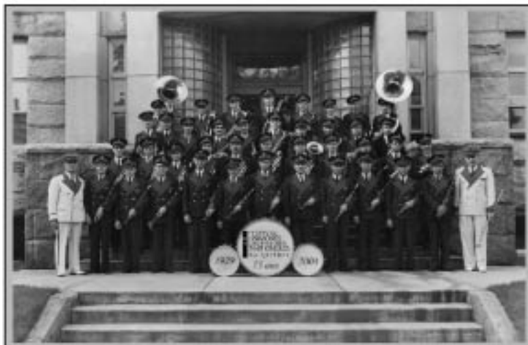
Harmonie de Granby, 1949

Merci ! À tous nos collaborateurs, supporteurs, commanditaires et bénévoles !