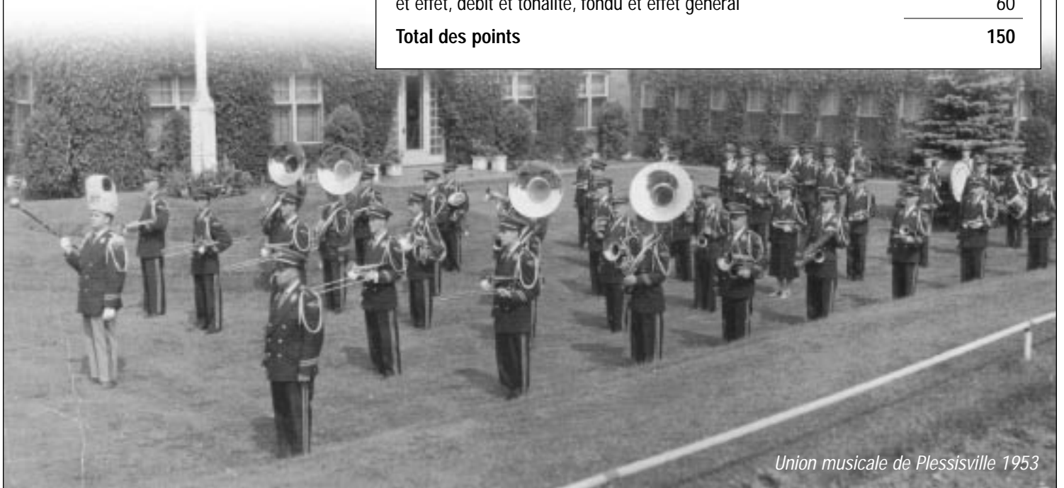
Union musicale de Plessisville 1953