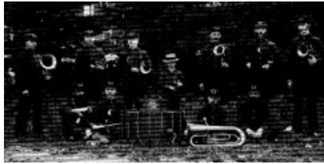
L'Harmonie de Sherbrooke, 1885

En 1978 , la Confédération des Harmonies-Fanfares du Québec ambitionne de devenir la Fédération des Harmonies du Québec . Les dernières formalités administratives permettront d'atteindre cet objectif au début de 1979. Une permanence est également créée et établie en 1978 au siège de la Confédération des Organismes du