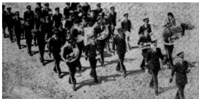
Fanfare d'Arvida, 1957