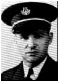
Président, Carolus Marquis de Granby, élu le 8 octobre Festival à Granby, le 18 juin