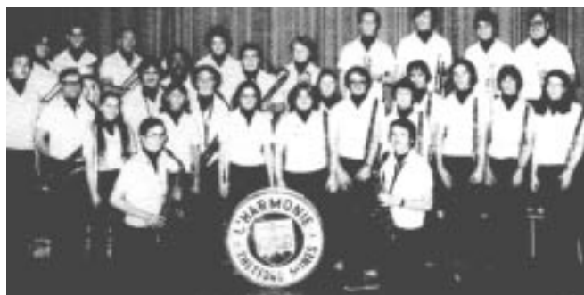
L'Harmonie de Thetford Mines, 1980

Cette décision fut prise à la suite de nombreuses consultations auprès de nos membres et parce que le besoin de répondre à la demande toujours croissante se faisait de plus en plus criant. Le Festival, qui a élu domicile à Sherbrooke depuis 1988 après de longues années d'itinérance, risquait l'asphyxie à court terme. De plus, les participants au Festival réclament depuis quelque temps déjà un horaire plus humain tout en souhaitant des activités connexes plus nombreuses. Le début du nouveau Concours devient donc le point de départ d'un renouveau pour la Fédération des harmonies et des orchestres symphoniques du Québec.