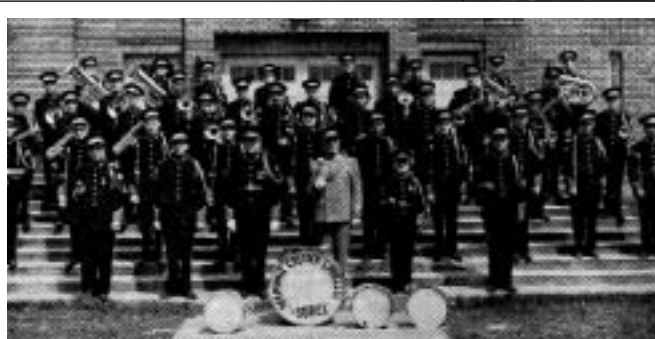
Harmonie Calixa-Lavallée de Sorel, 1949

Regroupement Loisir Québec au 1415, rue Jarry Est à Montréal. En 1985, les bureaux se transportent au 4545, ave Pierre-de-Coubertin – au Stade Olympique – au siège de ce qui est maintenant connu sous le nom de Regroupement Loisir Québec.